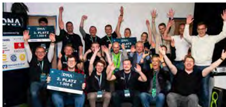
Die Siegerehrung des Hackathons 2024